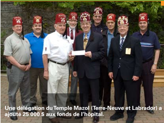
Une délégation du Temple Mazol (Terre-Neuve et Labrador) a ajouté 25 000 $ aux fonds de l'hôpital.